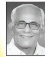
പി. കെ. വി. എൻ.എം. (വൈസ് പ്രസിഡന്റ്)

കൂടുതൽ വിവരങ്ങൾക്ക് 09414105093, 0982966869 സുപ്രസിദ്ധ ക്രൈസ്തവ ഗായിക സിസ്റ്റർ സംഗീതയുടെ നേതൃത്വത്തിൽ ഗാനശുശ്രൂഷ